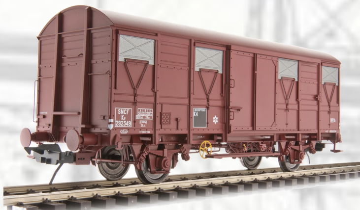
Réf 42247-01: Version SNCF 1964