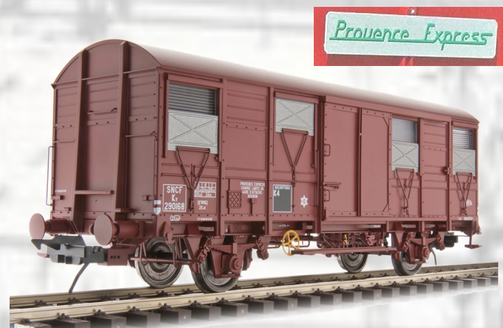
Réf 42247-02: Version SNCF Provence-Express