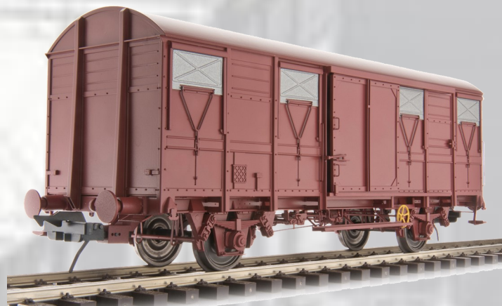
Réf 42247-90: Version sans marquage