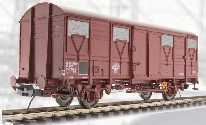
Réf 42247-03: Version SNCF 1968-1980