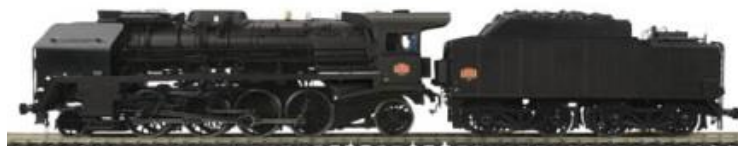
20-3488-2 141P dépôt de Chaumont (1 ex. dispo)