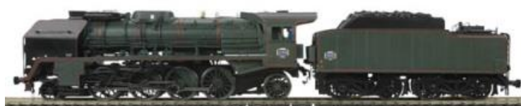
20-3489-2 141P ? dépôt du Mans (2 ex. dispo)