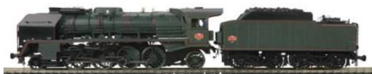
20-3491-2 141P ? dépôt de Vénissieux (1 ex. dispo)

Pour en savoir plus sur les caractéristiques des machines, voici un lien vers le catalogue européen MTH 2015 en français : http://www.mthtrains.com/sites/default/files/catalog_files/2015_mth_euro_fr/index.html