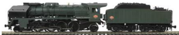
20-3487-2 141P8 dépôt d'Argentan (1 ex. dispo)

Je recevrai fin mai une première livraison de locomotives 141P (2 exemplaires de chaque référence), expédiées directement de Corée, que je vous propose au prix de 1499 € TTC port recommandé inclus. Les amateurs intéressés peuvent toujours réserver au moyen d'un acompte de 500 euro. Bien sûr, par la suite, de nouvelles commandes seront possibles, y compris en 3-rails. Les références disponibles en 2 rails sont :