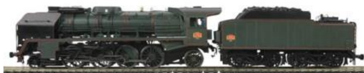
20-3490-2 141P ? dépôt de Noisy-le-Sec (2 réservées)