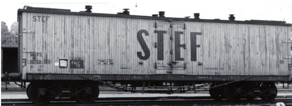
Ci-dessous, vers 1950